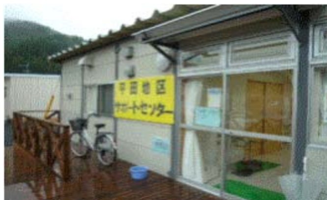
サポートセンター外観