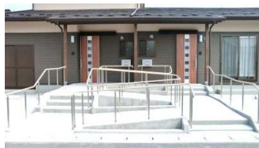
各住戸にスロープの設置