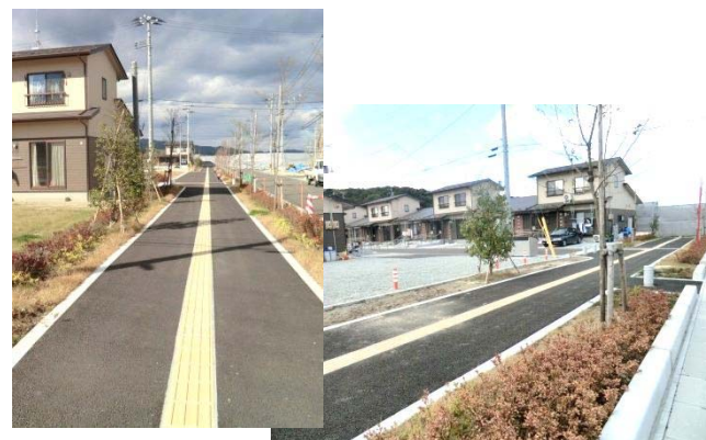
宅地内に緑道を設け、みどりの多い周辺環境に配慮