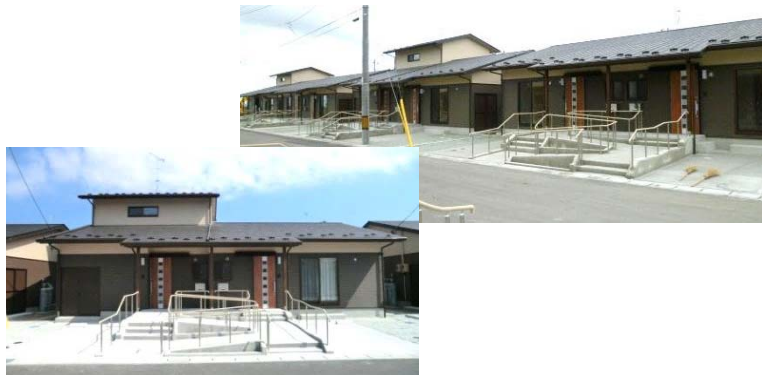
落ち着いた色調、低層な建築物を中心とした設計